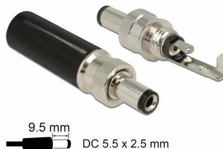
9.5 mm DC 5.5 x 2.5 mm

Αυτός ο σύνδεσμος DC της Delock είναι φτιαγμένος για τη συγκόλληση σε ένα καλώδιο και μπορεί να χρησιμοποιηθεί για τη σύνδεση διαφορετικών συσκευών με υποδοχή 5,5 x 2,5 χιλ. DC. Ο σύνδεσμος με τη βίδα στην υποδοχή υποστηρίζει σφιχτή σύνδεση με τις κατάλληλες υποδοχές DC της Delock π.χ. το αντικείμενο 89911.