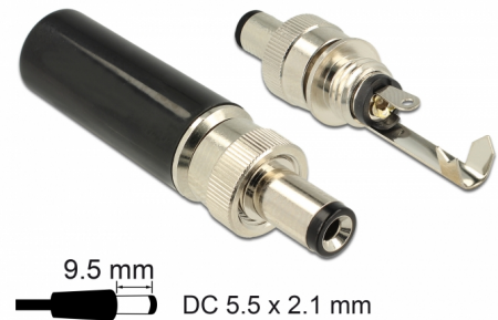
9.5 mm DC 5.5 x 2.1 mm

Αυτός ο σύνδεσμος DC της Delock είναι φτιαγμένος για τη συγκόλληση σε ένα καλώδιο και μπορεί να χρησιμοποιηθεί για τη σύνδεση διαφορετικών συσκευών με υποδοχή 5,5 x 2,1 χιλ. DC. Ο σύνδεσμος με τη βίδα στην υποδοχή υποστηρίζει σφιχτή σύνδεση με τις κατάλληλες υποδοχές DC της Delock π.χ. το αντικείμενο 89911.