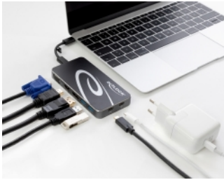
Maximum resolution (depending on the system and the connected hardware)