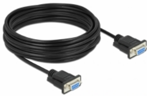
mini Sub-D 9