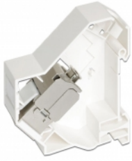
Anwendungsbeispiel mit Stecker