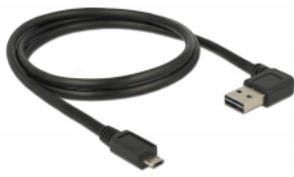
EASY-USB Micro B PCB with both sided contacts