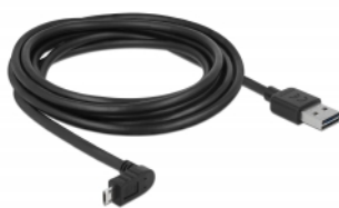
EASY-USB Micro B PCB with both sided contacts