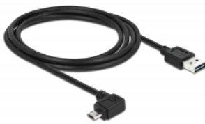
EASY-USB Micro B PCB with both sided contacts