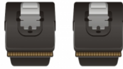
SAS 36 Pin