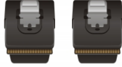
SAS 36 Pin