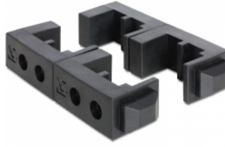
unlimited stackable incl. holders only for 1 x 3.5" HDD or 2 x 2.5" HDD