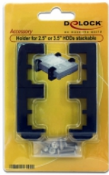
unlimited stackable incl. holders only for 1 x 3.5" HDD or 2 x 2.5" HDD